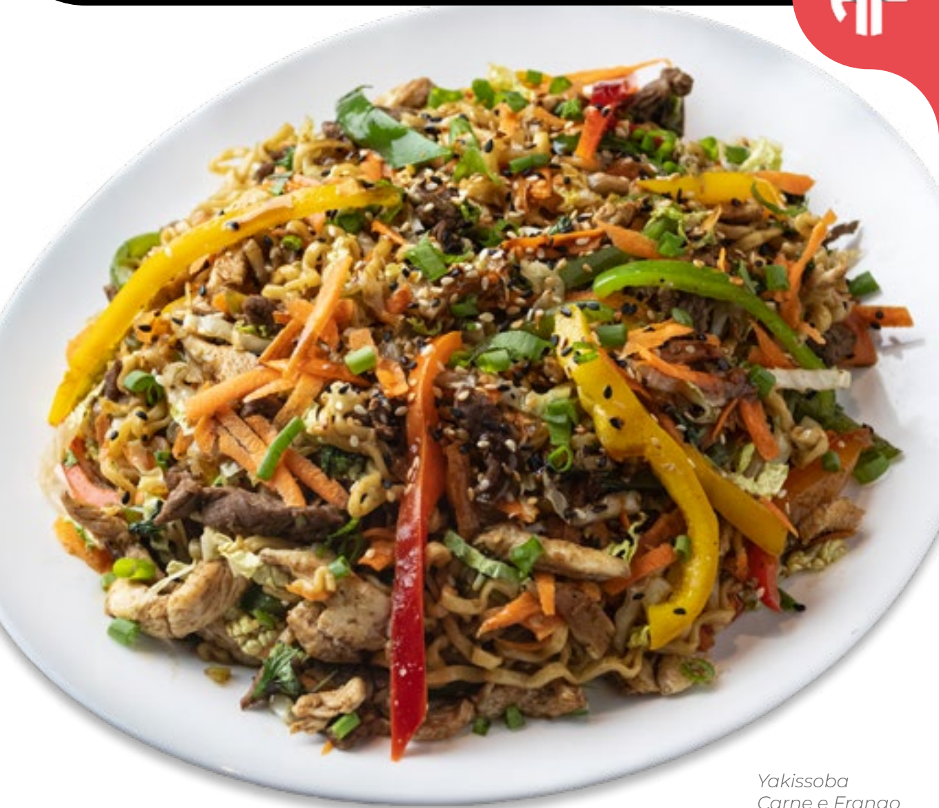
Yakissoba Carne e Frango Imagem meramente ilustrativa