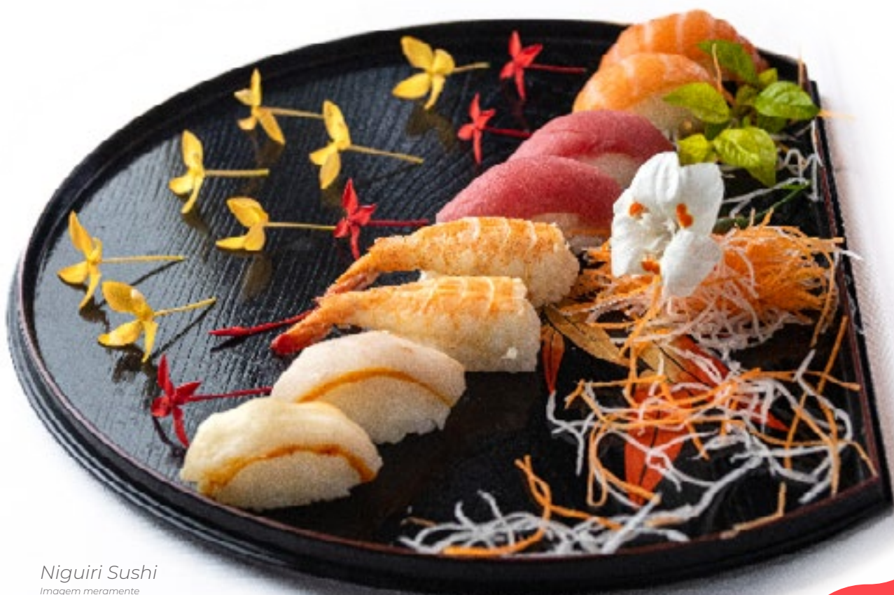
Niguri Sushi Imagem meramente ilustrativa