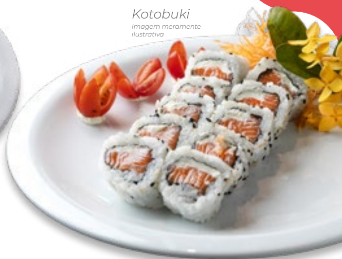
Kotobuki Imagem meramente ilustrativa