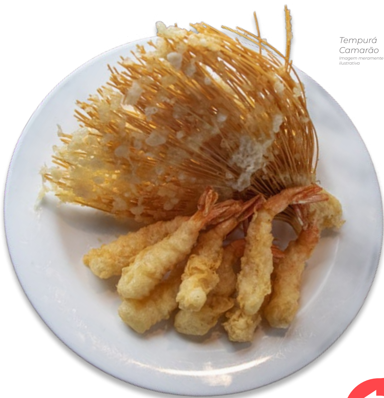
Tempurá Camarão Imagem meramente ilustrativa