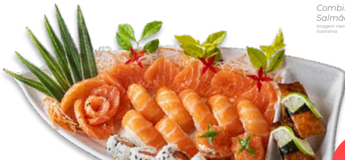
Combinado Salmão Imagem meramente ilustrativa

Combinação de sashimis (20 un.), niguiris (8 un.), Califórnia (4 un.), kotobuki (4 un.), hot harumaki (4 un.), hot salmão (4 un.) e gunkan (4un.)