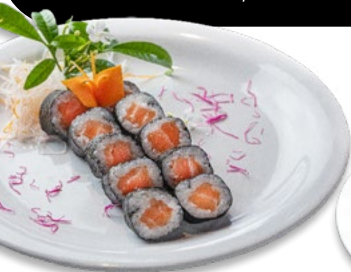
Sakemaki Imagem meramente ilustrativa