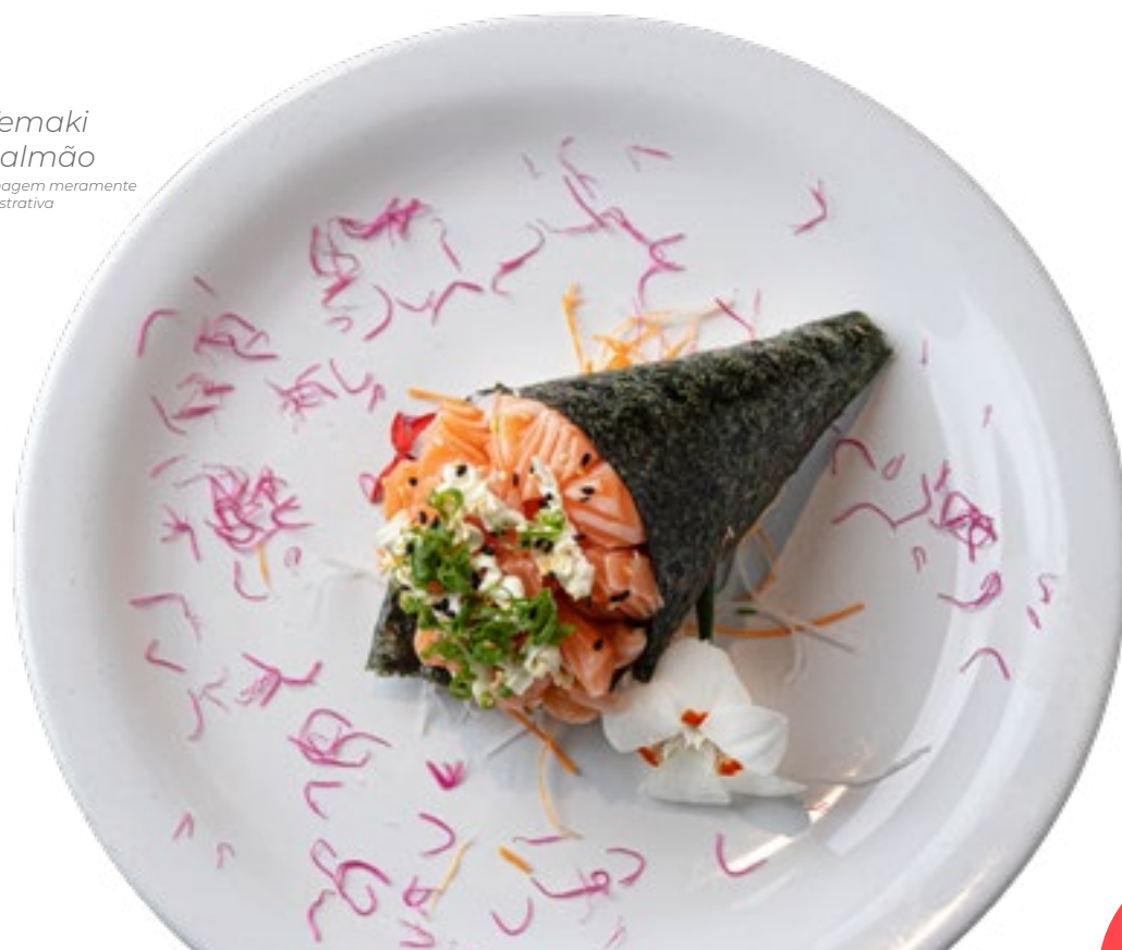
Temaki Salmão Imagem meramente ilustrativa