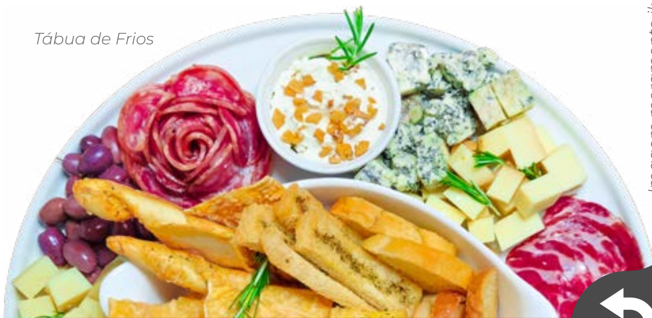
Tábua de Frios