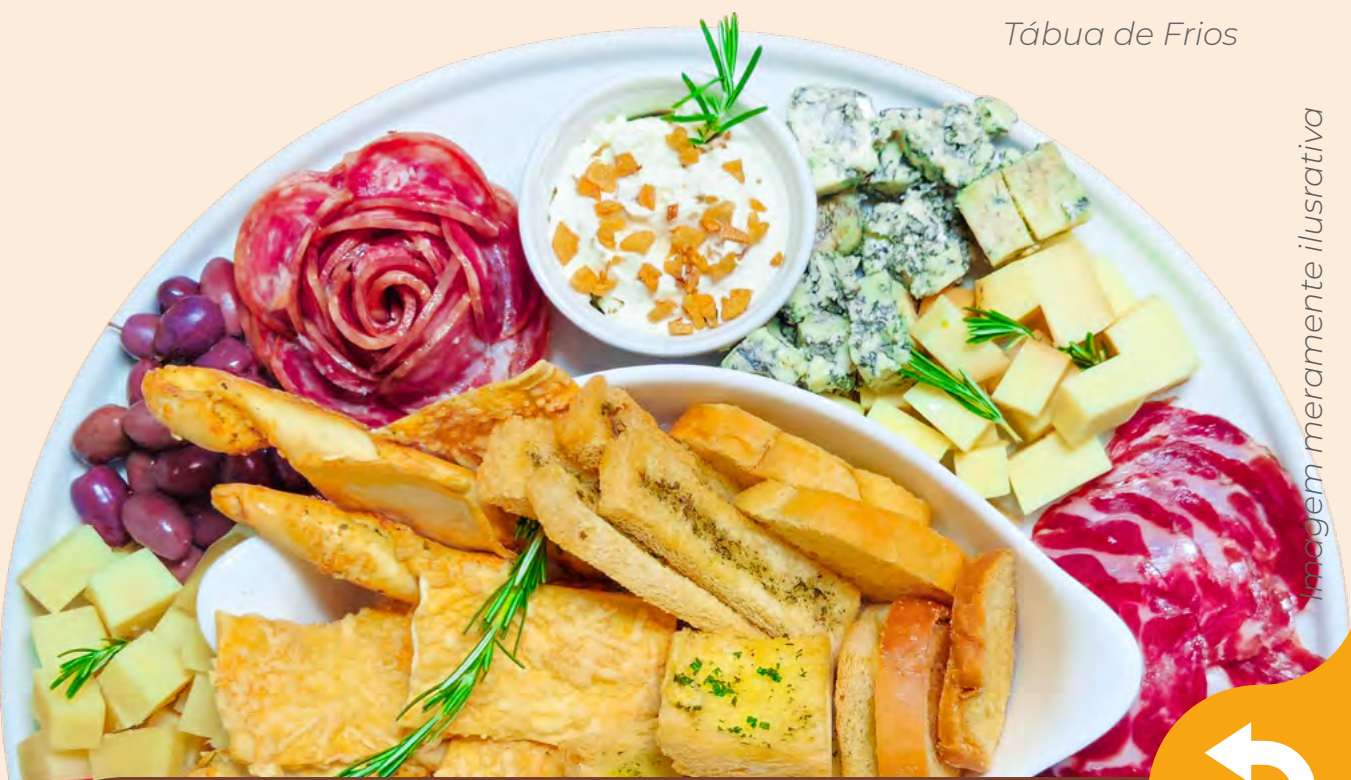
Tábua de Frios

Isca de pescada (200g*), empanada com farinha crocante e servida com molho tártaro.