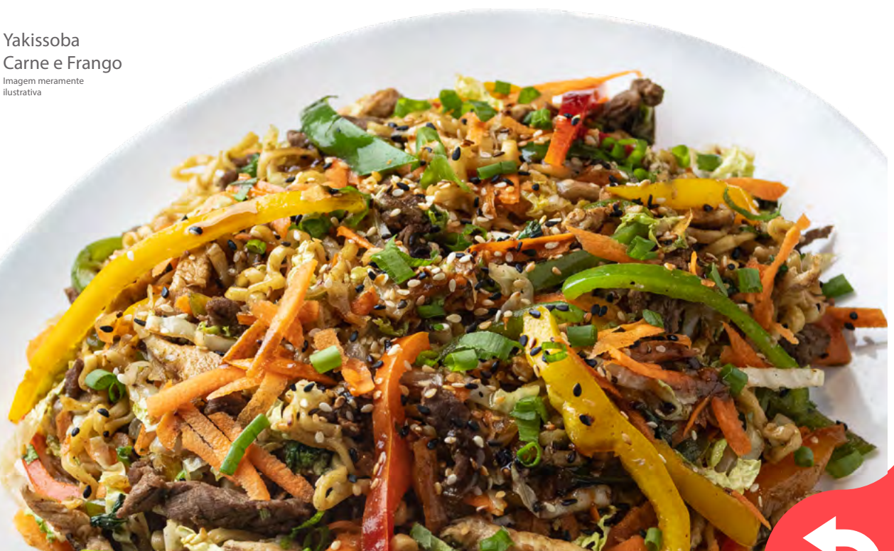
Yakissoba Carne e Frango Imagem meramente ilustrativa