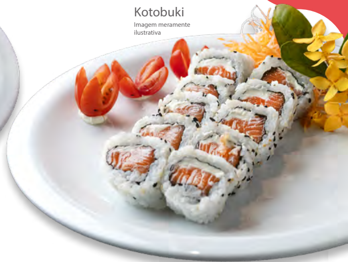
Kotobuki Imagem meramente ilustrativa