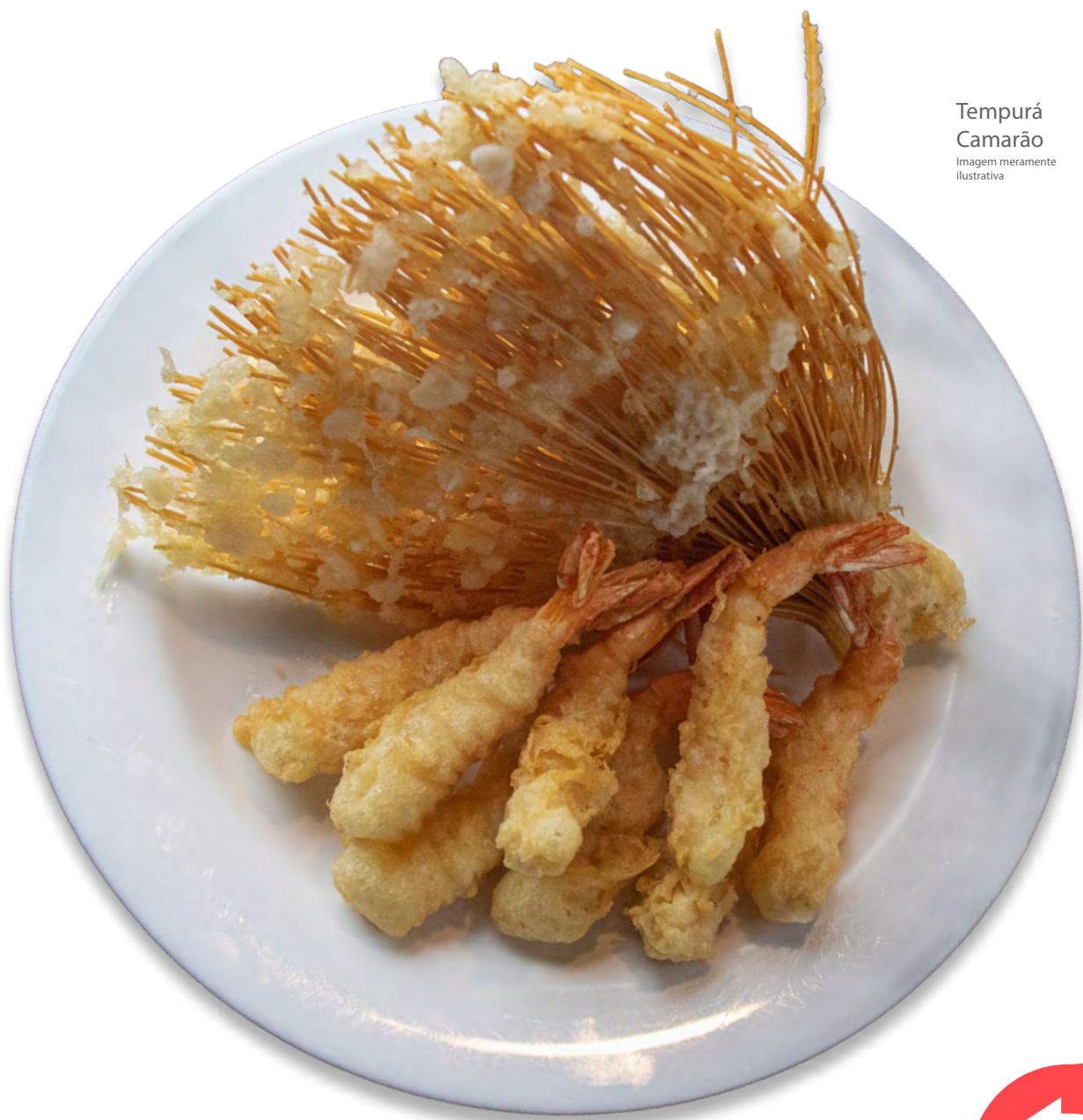
Tempurá Camarão Imagem meramente ilustrativa