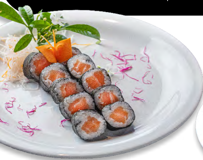
Sakemaki Imagem meramente ilustrativa