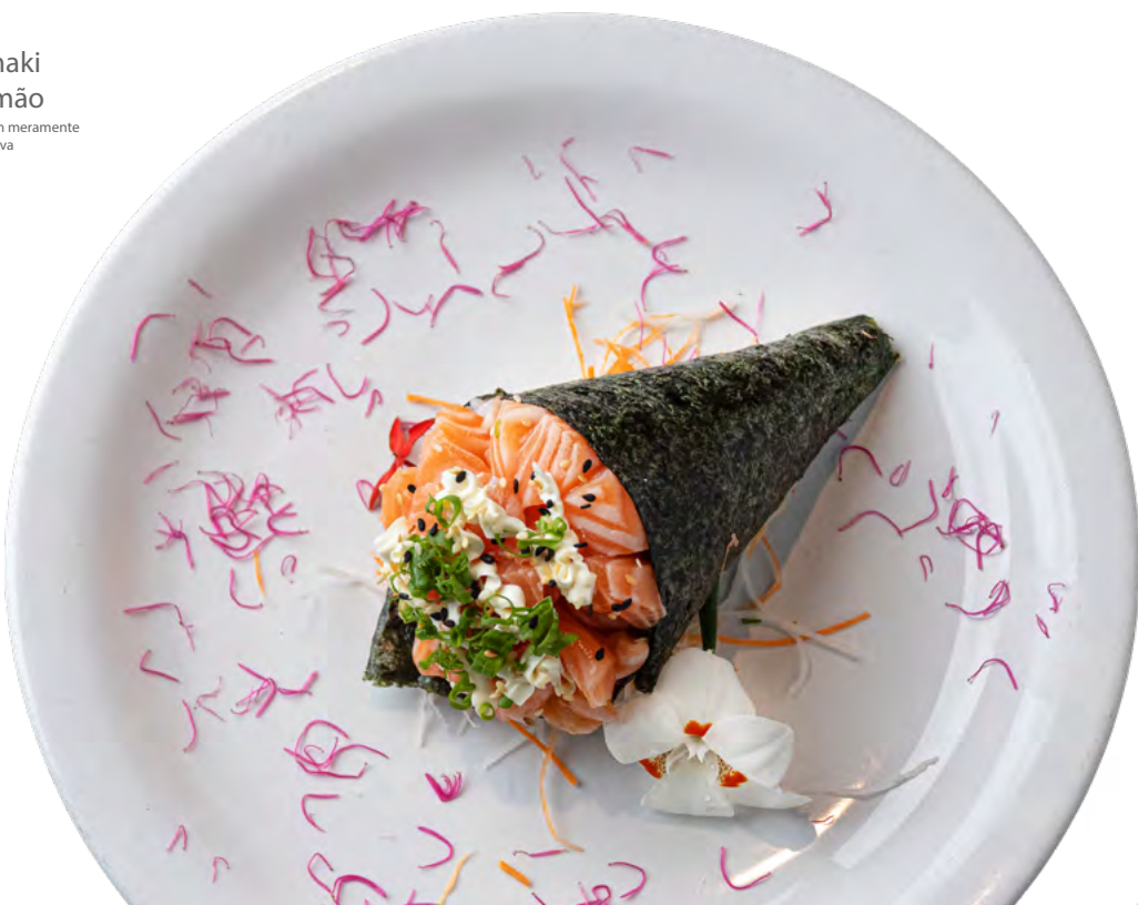
Temaki Salmão Imagem meramente ilustrativa