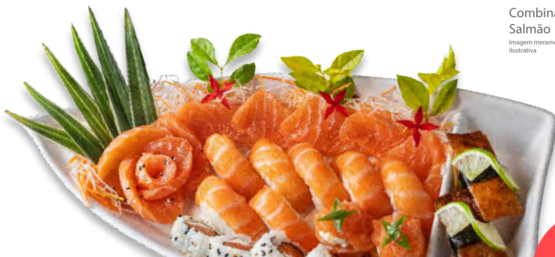
Combinado Salmão Imagem meramente ilustrativa

Boat 2 (48 unidades) R$ 214,00 Combinação de sashimis (20 un.), niguiris (8 un.), Califórnia (4 un.), uramaki Filadélfia (4 un.), harumaki (4 un.), hot salmão (4 un.) e gunkan (4un.)